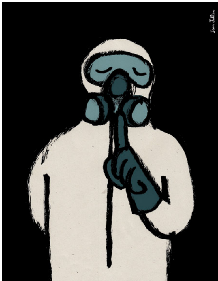
Illustration : Jean Jullien

LE FIL IDÉES - La catastrophe au Japon a sonné le glas du mythe de la sécurité nucléaire. Il est temps de prendre conscience que les choix énergétiques de notre pays n'ont jamais été discutés. Retour sur cinquante ans de déni à l'occasion d'une soirée consacrée au nucléaire sur Arte.