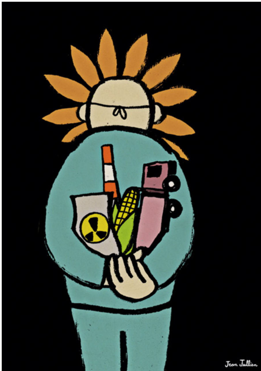
Illustration : Jean Jullien

L'extrême gravité de la situation au Japon est en train de mettre à bas ces constructions médiatiques, ce déni de démocratie. La stratégie des industriels consistant à rassurer sur les risques encourus sans jamais en expliquer la nature perd son efficacité : les conséquences d'un accident s'étalent sous nos yeux. Difficile aussi de formuler la célèbre et abusive alternative, « le nucléaire ou la bougie » : aujourd'hui, les Japonais ont le nucléaire ET la bougie. Le vieil antagonisme entre « pro » et « anti »-nucléaires, entretenu par les tenants de l'atome pour neutraliser le débat, ne tient plus : un tsunami aux antipodes prouve que nous sommes tous « dans » le